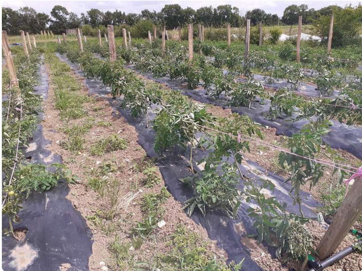
Tomate plein champ, système de tuteurage qui permet de maintenir les plantes. Densité faible = moins de risque de mildiou. Protection cuprique fortement conseillée. Sud 79, 02/07/24