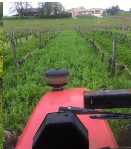
Légende : Développement du couvert durant l'automne et l'hiver