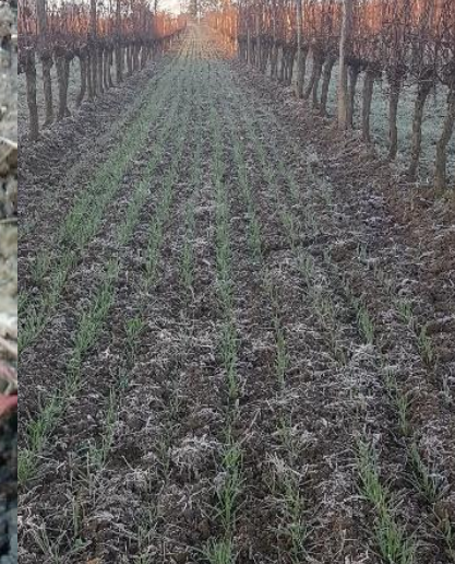
Légende : Semoir à disque couplé à une herse rotative de fabrication artisanale (à gauche), semis sur sol travaillé et germination (au milieu), levée et croissance (à droite)