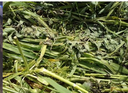
Légende : Destruction avec un rouleau faca au printemps