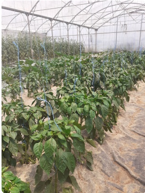
Poivron sur ficelle Centre 79, 25/06/24

Prévoyez un système de support pour éviter la chute/casse des plants lorsque la charge en fruit augmente :