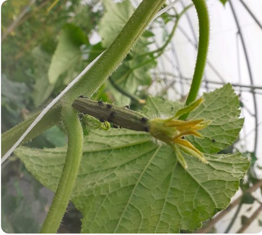
Jeunes larves, Centre 79 - 21/06/24

Ci-dessus : Flétrissement bourgeon apical suite piquere punaise. Laisser partir un gourmand en tête de plante. Sud 79 - 24/06/24